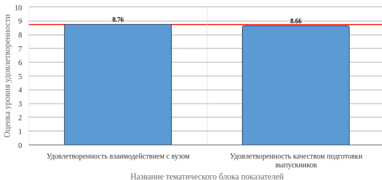
Рисунок 2.1 - Средняя оценка удовлетворенности (по тематическим блокам показателей)

Средняя оценка удовлетворенности респондентов по блоку вопросов «Удовлетворенность взаимодействием с вузом» равна 8.76, что является показателем высокого уровня удовлетворенности (75-100%).